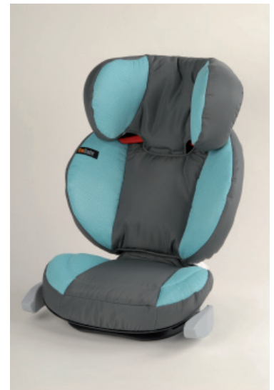
Der Fortschritt ist unverkennbar. Links ein Produkt aus dem Test von 1968, rechts ein Sitzehöher mit Rückenlehne aus dem Jahr 2009.

Viele weitere Informationen zu diesem Thema sind in der 48-seitigen Broschüre «Auto-Kindersitze» enthalten, die hier gratis bestellt werden kann.